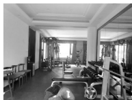
杭州市上城区综合行政执法局 2021年11月9日