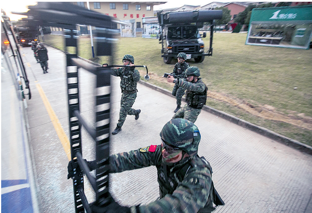
11月9日,武警浙江省总队机动支队组织特战分队开展交通工具反劫持演练,重点对攻心劝降、多点狙击、车窗破坏、核心突入等战法进行训练,练指挥、练协同、练战术,进一步提高部队反恐处突能力。

楼梯口、疏散通道、消防车通道都是生命通道。“双11”期间生意再火爆,电商、仓储、物流等企业也万万不可堵住生命通道,要及时对货物进行整理,不要占用楼梯口随意乱堆乱摆货物,设置防火分区,让出消防车通道;此外,要落实消防安全责任,积极开展消防安全自查,加大员工宣传培训力度,熟练掌握灭火器的使用方法。