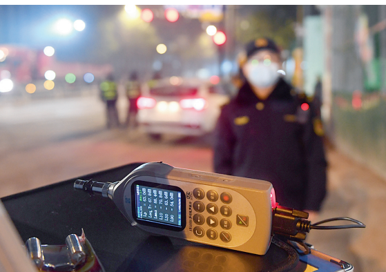
执法队员在工地外围测量噪音