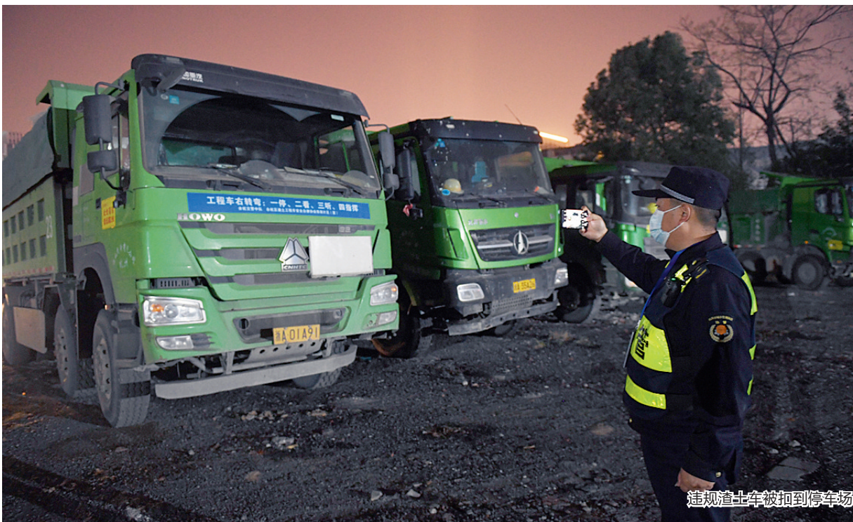
违规渣土车被扣到停车场