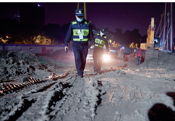
工地里的路特别泥泞