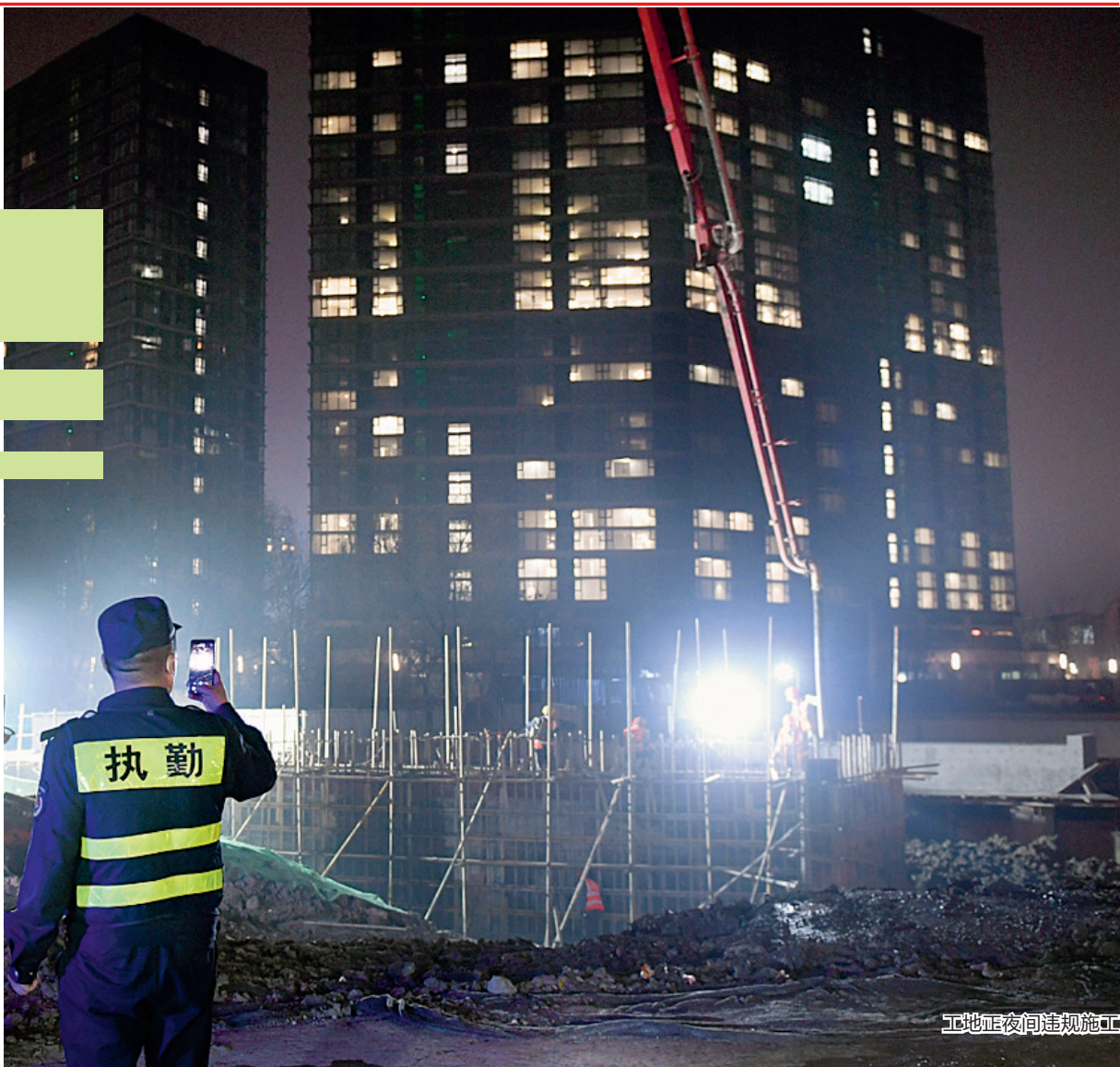
工地正夜间违规施工

大门紧闭,里面却在偷偷作业。最近,杭州部分工地在未取得夜间施工证的情况下,偷偷违规施工。1月3日晚,记者跟随杭州市西湖区城市管理执法局三墩中队执法队员夜查,现场发现部分违规施工企业,并作立案处理。