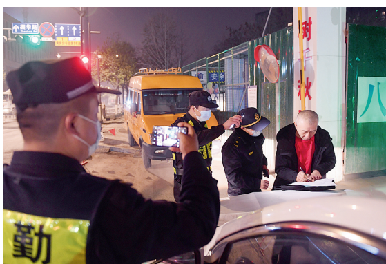
工地负责人对违规施工行为签字确认