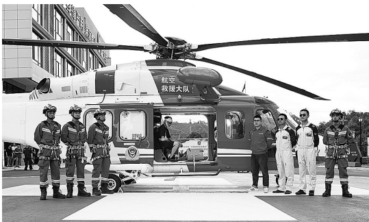
建立航空救援专业队

“不要急,戴上面罩贴着墙走……”2021年11月30日,杭州市益农镇一民房起火,有8名人员被困。消防救援人员到场后,迅速将面罩戴在被困人员头上,不到5分钟,被困人员全部获救。 与时间赛跑,把握好每一秒、守护住每一条生命,对于消防救援人员来说,需要的不仅是速度,还有承载“速度”背后的专业支撑。