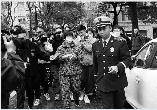
小区生命通道贴单式违停执法

绍,“推出‘委托式’执法,不仅打通了执法壁垒,更有效破解了基层消防管理‘真空’和监督执法‘空白’的难题。” 不仅如此,支队还研发了消防简易处罚系统、“生命通道”执法系统,便于一线执法人员操作,大大提升了执法办案效率。同时,创新推出高层建筑“一码通”闭环管理,被杭州市政府评为首批“数字法治好应用”。 2021年以来,支队认真贯彻上级领导指示,立足全市消防安全形势,部署开展了生命通道、高层建筑、居住出租房、密室逃脱类场所等系列专项整治行动。督促指导172个小区消防车通道、登高场地覆绿,消火栓无水等高风险隐患完成整改;指导推进3399个居住小区完成消防安全综合治理试点建设,283个老旧小区完成消防安全提升改造,12.9万余户居住出租房完成隐患排查整改,办理电动自行车处