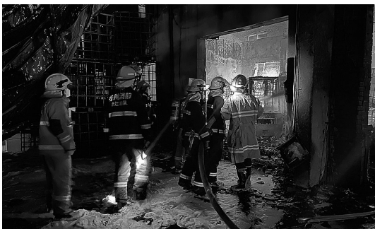
“4.6”余杭博陆生物化工仓库火灾扑救

“不要急,戴上面罩贴着墙走……”2021年11月30日,杭州市益农镇一民房起火,有8名人员被困。消防救援人员到场后,迅速将面罩戴在被困人员头上,不到5分钟,被困人员全部获救。 与时间赛跑,把握好每一秒、守护住每一条生命,对于消防救援人员来说,需要的不仅是速度,还有承载“速度”背后的专业支撑。