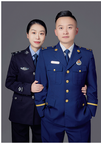
两人的第一张合照