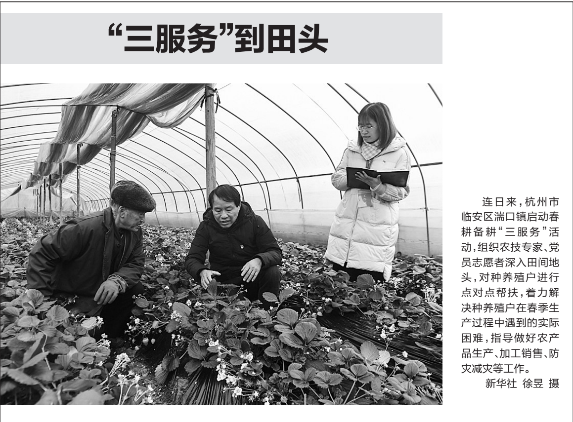
连日来，杭州市临安区湍口镇启动春耕备耕“三服务”活动，组织农技专家、党员志愿者深入田间地头，对种养殖户进行点对点帮扶，着力解决种养殖户在春季生产过程中遇到的实际困难，指导做好农产品生产、加工销售、防灾减灾等工作。

除了帮助企业减负增效，“易制毒化学品监管应用”也使政府部门对易制毒品行业监管由经验管控、单一管控提升为数字智控、全域管控，每年可“解放”监管力量1000余人次，实现警务、监管效能的提升。