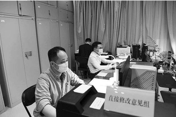
国务院办公厅工作专班工作人员在认真工作