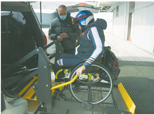
为保障残疾人运动员活动便利,北京冬奥会和冬残奥会延庆赛区国家高山滑雪中心为残疾人运动员提供专用车辆。

北京冬奥组委新闻发言人赵卫东介绍,“残疾人冰雪运动季”举办以来,参加的省区市从最初的14个增长到现在的31个,直接参与的人数从最初的万人发展到30多万人。此外,中国残联自2017年开始举办全国冬季残疾人社会体育指导员训练营,目前也已培训上万人。