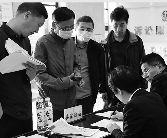
浦江法院开展执行工作大接访活动

“执行工作不仅仅是对外的执行活动,还有很多群众们看不到的内部工作,例如由我们中院牵头组织全市法院开展交叉巡查、执行督查等活动。执行确实是一块难啃的‘硬骨头’,我们不仅要有‘铁齿铜牙’,还要广借外力、内外联动。发扬冲劲、保持韧劲、会用