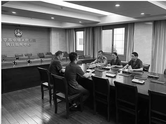
金华中院工作人员讨论杨某某等人电信网络诈骗案返款方案

“你是骗子吧?你这个套路我是明白的。”没想到,在电话联系过程中,执行员却屡屡被当成骗子被挂断