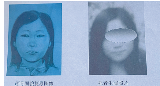
颅骨面貌复原图像

有一年，我去中国美院进修的时候，一名教授对我说，他们画画是纯粹的美术，是为了欣赏；而我画画，是为了救人，为了破案。那时候，我开始觉得，不管手中是柳叶刀还是碳素笔，都是划开黑暗的“利剑”。