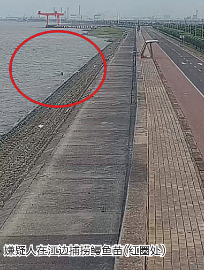
嫌疑人在江边捕捞鳊鱼苗(红圈处)

这些人為何如此疯狂,甚至不惜以身试险?本报记者独家采访多名办案民警,揭开其中“奥秘”。