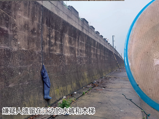
嫌疑人遗留在江边的水裤和木梯