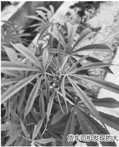
货车司机发现的大麻

如何分辨是杂草还是大麻,警方提醒,大麻的叶子呈掌状,有5-7个裂片,且叶边缘具锯齿。希望大家擦亮眼睛,一起“扫毒”。