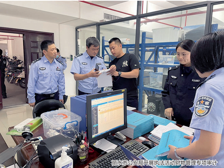
丽水市公安局开展执法活动财物管理专项审计