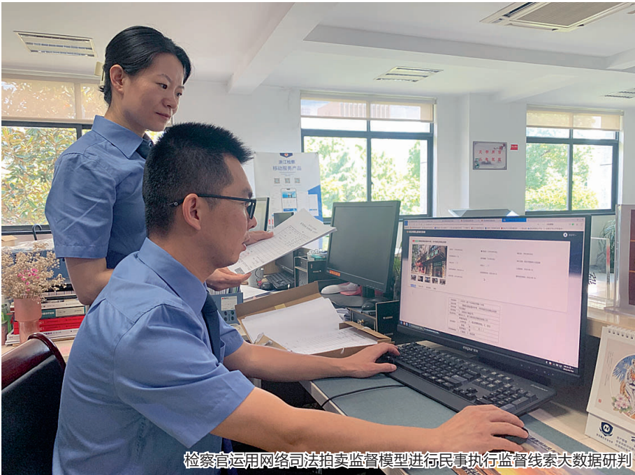
检察官运用网络司法拍卖监督模型进行民事执行监督线索大数据研判