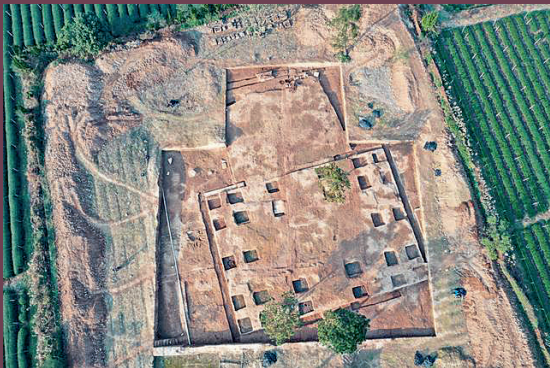
宋六陵2号陵园考古工地现场