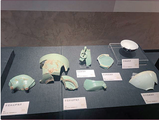
宋六陵遗址出土的青瓷