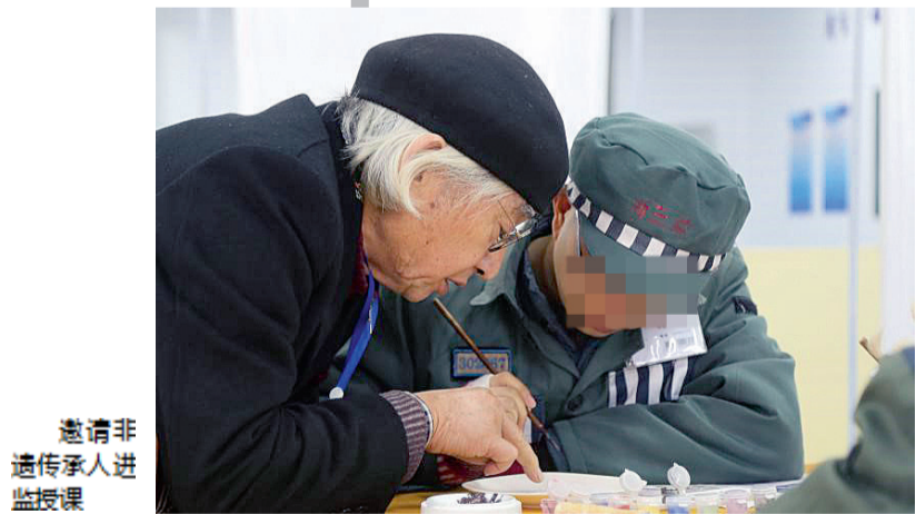
邀请非遗传承人进监授课

像这样主动将监狱工作融入地方发展大局,实现资源共享共赢发展的例子还有很多很多。从最初的关起门来“单打独斗”,到如今主动开门走出去、融进去,浙江监狱系统打开监地协作新局面,不断绘就平安浙江新风景。