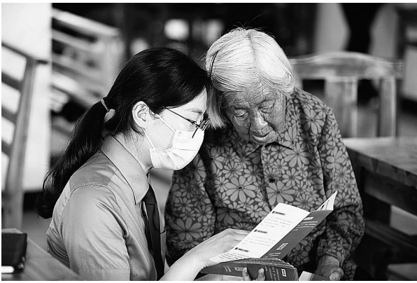
义乌市检察院检察官为老人讲解防诈知识