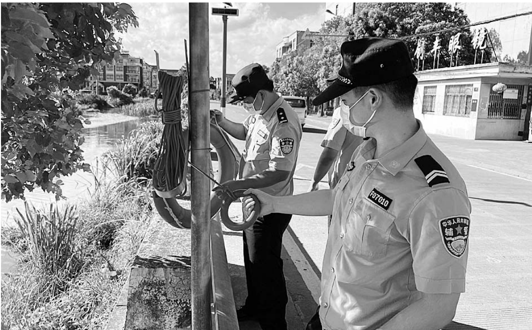
入夏以来,台州市公安局椒江分局前所派出所每天安排警力到辖区河道开展巡逻检查,有效预防溺水事故发生。图为8月10日下午,民警正在检查河道边的防溺水救生设备。