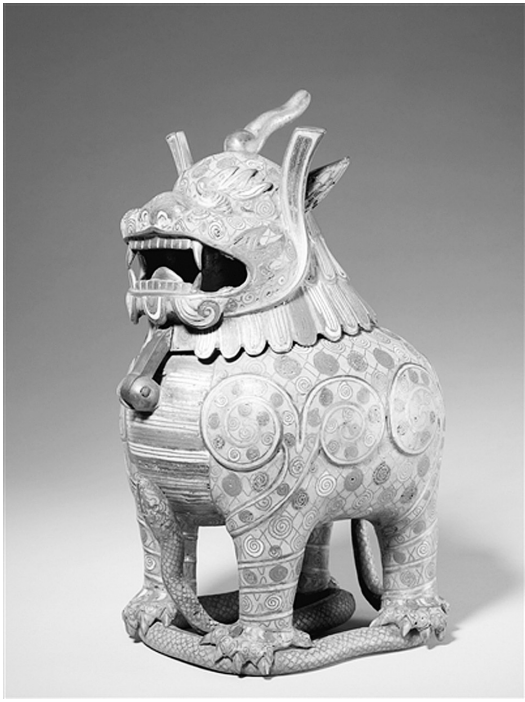
万历款柏丝珐琅用端香珠