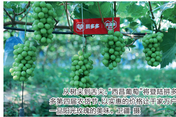
从树尖到舌尖,“西昌葡萄”将登陆拼多多第四届农货节,以实惠的价格让千家万户一品阳光玫瑰的美味。

据拼多多农货节负责人介绍,“超级农货节”是下半年农产品线上销售旺季的开端,以此为起点,平台将针对石榴、葡萄、猕猴桃、大闸蟹等品类,围绕特色鲜