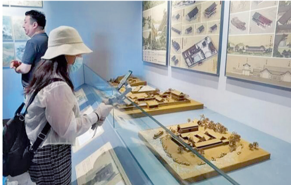
游客在参观避暑山庄古建筑数字化复原艺术展。

为加强避暑山庄的历史原貌研究和文化传承,承德市文物局联合中央美术学院组建避暑山庄数字化复原研