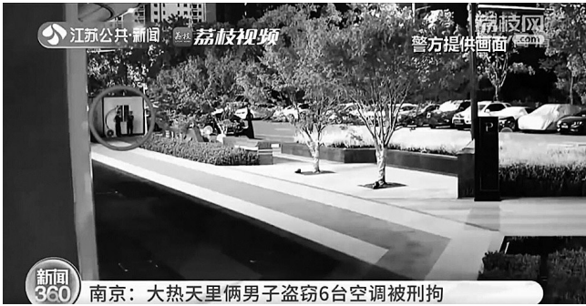
南京:大热天里俩男子盗窃6台空调被刑拘

近日,江苏南京一居民报警称,有两名男子凌晨鬼鬼祟祟出没在核酸检测点附近。民警通过查看监控发现,两名嫌疑男子分工作案,先后到4个核酸检测点偷盗了6台空调,总价值1万多元,并以不到2000元的价格转手给二手空调回收商。目前,两名男子已被刑拘。