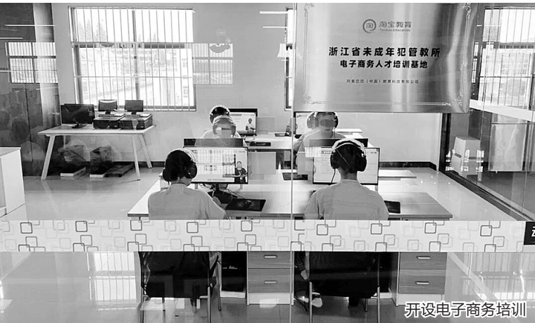
开设电子商务培训