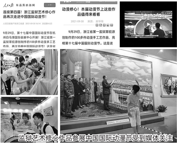
监狱艺术修心作品参展中国国际动漫节受到媒体关注