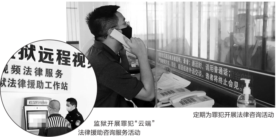
监狱开展罪犯“云端”法律援助咨询服务活动

此外,省之江监狱还依靠各级司法行政机关,积极动员辖区内有关部门和社会力量靠前关心关爱罪犯未成年子女,并对困难对象及时提供法律援助和司法救助。