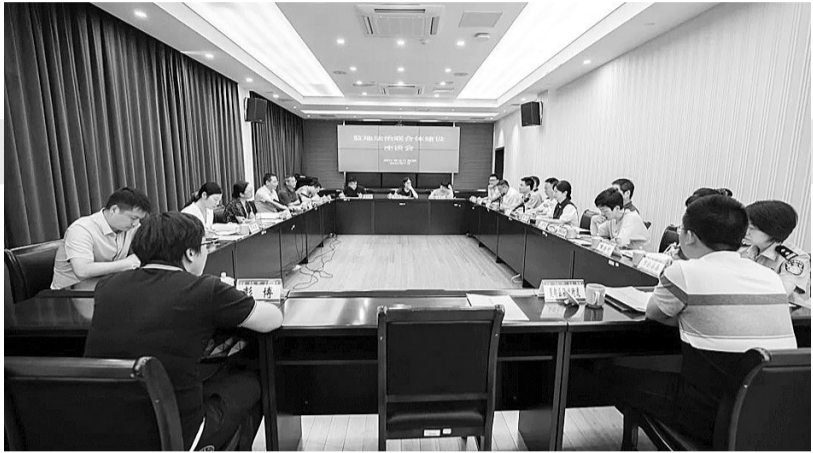
监地“法治联合体”建设座谈会

2021年3月,省之江监狱与丽水市司法局联合下发《关于加快构建“法治联合体”助推监地融合发展的通知》,确立了监狱与各级司法行政机关协同协作模式,建立了常态化沟通联络和议事协调机制。同年8月,丽水市委全面依法治市委员会办公室和省之江监狱建立“法治联合体”领导小组,公布首批18个任务目标。