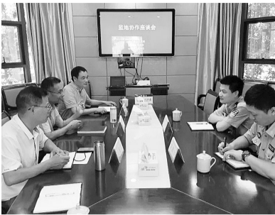
监狱赴莲都区司法局开展监地协作座谈

“通过监地协作,我们与各级司法行政机关围绕刑罚执行一体化建设、远程视频会见、回归就业、共同预防和减少犯罪、刑释人员教育改造