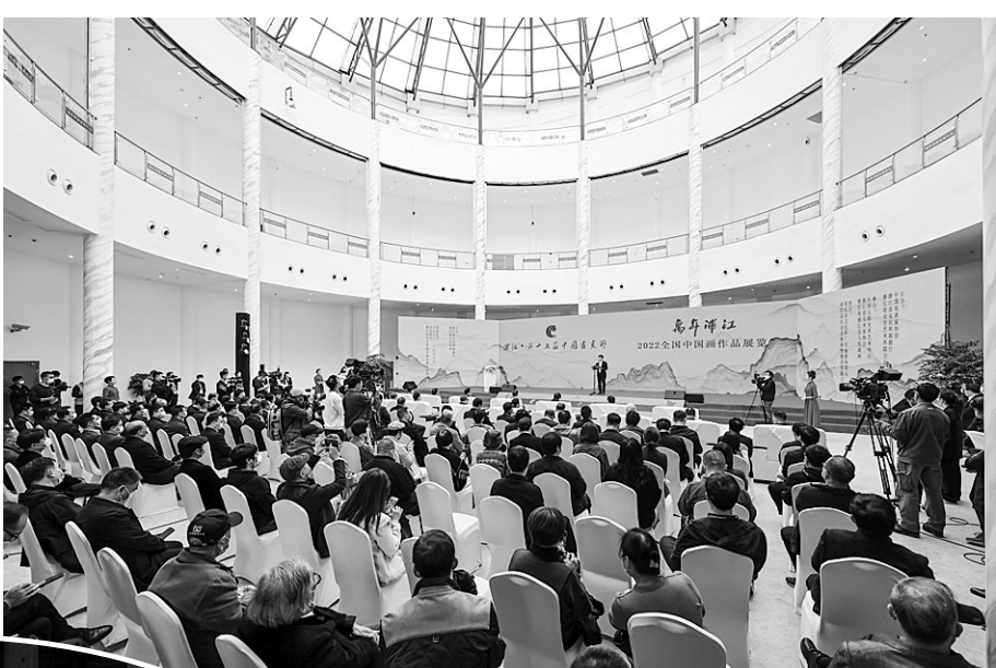
书画节开幕式现场

好优秀传统文化与健全现代公共文化服务体系、现代文化产业体系和市场体系有机结合起来,创新实施文化惠民、文化富民工程,重点突