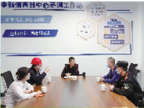
矛调工作站调解现场