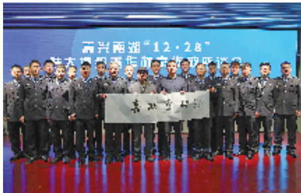
“12·28”特大侵犯著作权案侦破座谈会