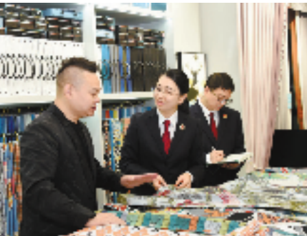
检察官走访轻纺城打造法治化营商环境

2022年4月，在全区建设平安柯桥工作会议暨“除险保安”动员大会上，柯桥区委书记与各镇（街道）主要负责人签订“除险保安”责任状，充分落实“第一责任人”制度。 一年来，为全面推进平安柯桥建设，柯桥区不断加强对平安建设的组织领导，区委主要领导亲自谋划、亲自部署开展平安创建晋位、社会治理强基等八大专项行动，组建重大维稳安保、信访积案清零等九个专班，建立领导推进、例会协调、清单销号、“赛马”晾晒、督查考核五大机制。平安责任由部门单向为主向部门、镇街双向转变、镇街工作由被动应付向主动作为转变，部门、镇街之间协调配合力度得到全面强化，平安创建氛围日益浓厚，“平安三率”明显提升，问题整改效率实现质变。