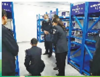
临海市刑事诉讼涉案财物管理中心物