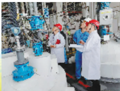
2022年5月6日,“百日除百患”行动期间,临海市应急管理局邀请专家对全市危化证保管区一角生产企业开展安全检查