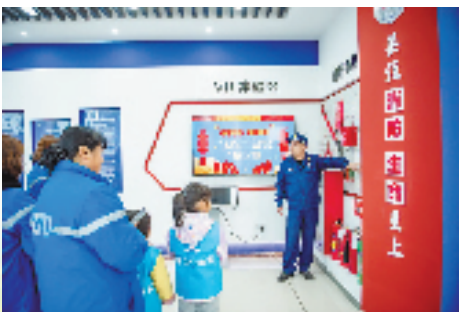
临海市沿江镇中通平安驿站举办小学生安全知识宣讲活动