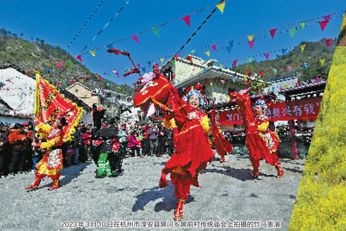
2023年3月10日在杭州市淳安县屏门乡屏前村传统庙会上拍摄的竹马表演