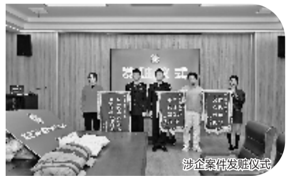
涉企案件发赃仪式