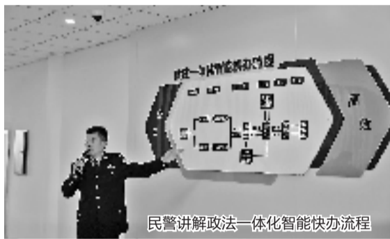
民警讲解政法一体化智能快办流程