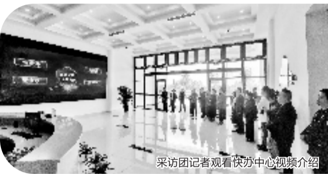
采访团记者观看快办中心视频介绍

4月12日,平湖市政法一体化涉企案件快办中心举行发赃仪式,警方通过涉企案件一体化快办机制,向3家企业提前发还价值45余万元的涉案财物。当日,“市域社会治理现代化·全国媒体浙江行”采访团的记者们也现场参加仪式,体验了一把平湖对涉企案件的“快办速度”。