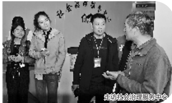
走访社会治理服务中心