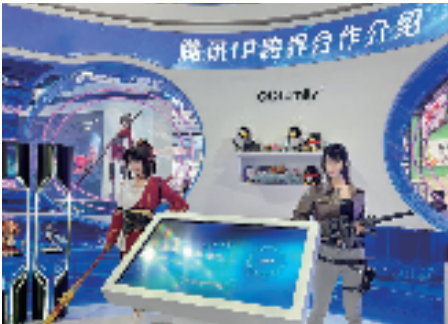
展会融合AI技术和商业变革,展望数字化未来市场