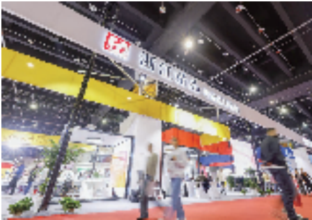
浙江精品,引领品质生活