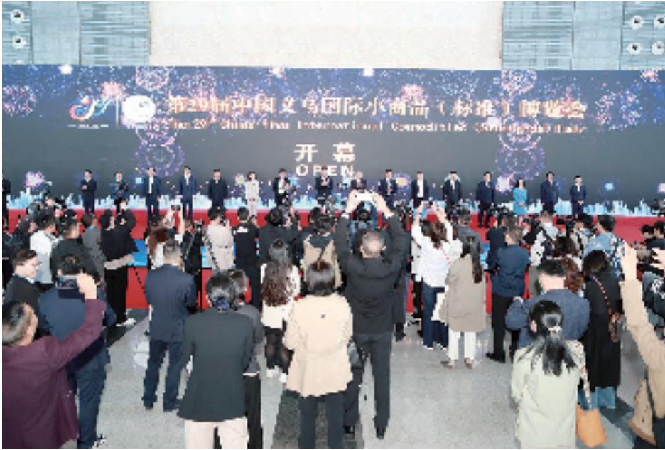
第29届义博会开幕现场

义博会期间,市场监管总局还在义乌召开国家标准专题新闻发布会,对一批重要国家标准进行宣传解读,涉及家具、纺织品、城市建设等领域。