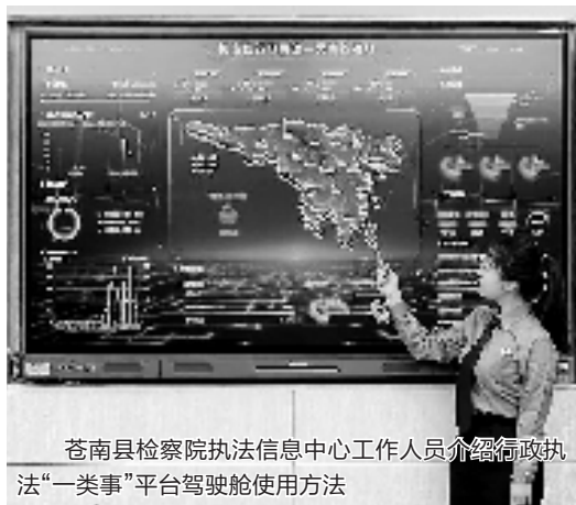
苍南县检察院执法信息中心工作人员介绍行政执法“一类事”平台驾驶舱使用方法

示平台,也是检察机关借助大数据推进精准服务企业的智能辅助平台。”苍南县检察院副检察长池长该介绍。该平台架设于该院开发的“执法司法大数据智能