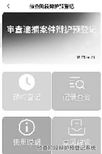
侦查阶段辩护预登记

平台上线以来,已为律师提供提醒服务107人次,获得律师界的充分肯定,包括人大代表、政协委员在内的多名律师专门短信或电话致谢。