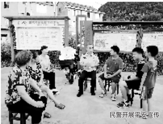
民警开展平安宣传

“沿江枫警队”是沿江镇首支“平安义警”队伍,由派出所民警、新居民联谊会成员和爱心志愿者组成,防溺水巡逻、村BA保卫等等都有他们的身影。这是他们日常工作的真实写照,也是当