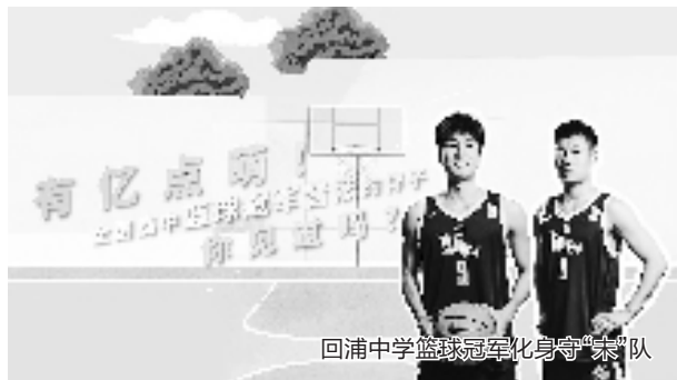
回浦中学篮球冠军化身守“未”队

矫治干预帮扶工作,并按照“红黄蓝”三级预警机制分类分级建档,同时充分运用“心灵驿站”公益平台、“心晴驿站”电话亭、“12355”青少年服务热线等,靠前化解青少年心理危机隐患,成功处置8起线上心理危机事件,并对36名未成年人家长开展强制亲职教育。