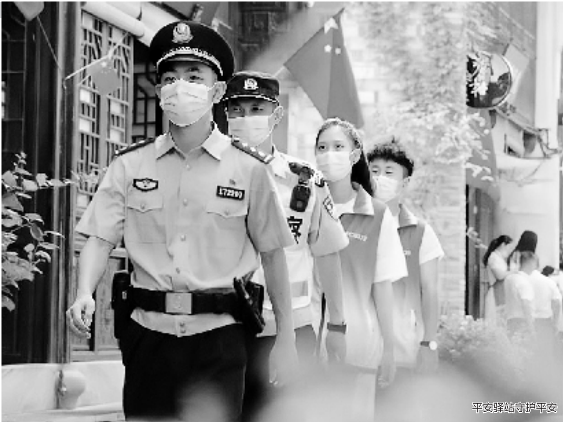
平安驿站守护平安

春无遗勤,秋有厚翼。通过联办群众活动、联调矛盾纠纷、联合区域执法、联动网格力量等措施,平安驿站自运行以来共开展巡演10场,服务群众300余次,受理咨询800余次,化解矛盾纠纷500余起,真正实现“资源在驿站集成、情绪在驿站疏导、矛盾在驿站化解、隐患在驿站消除”。