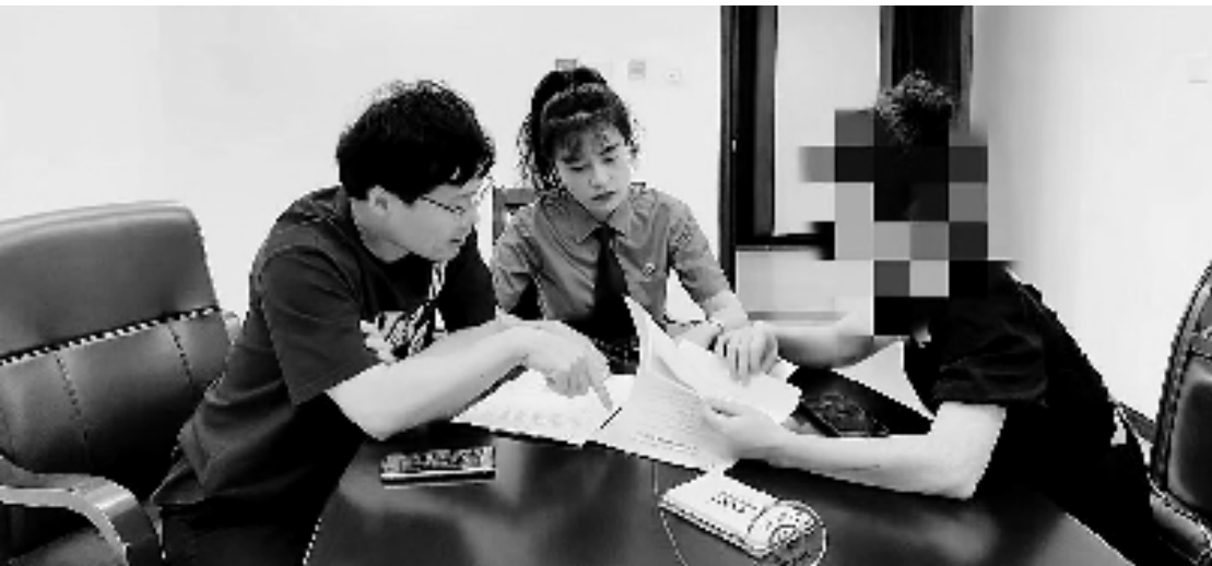
当事人向检察官寻求帮助