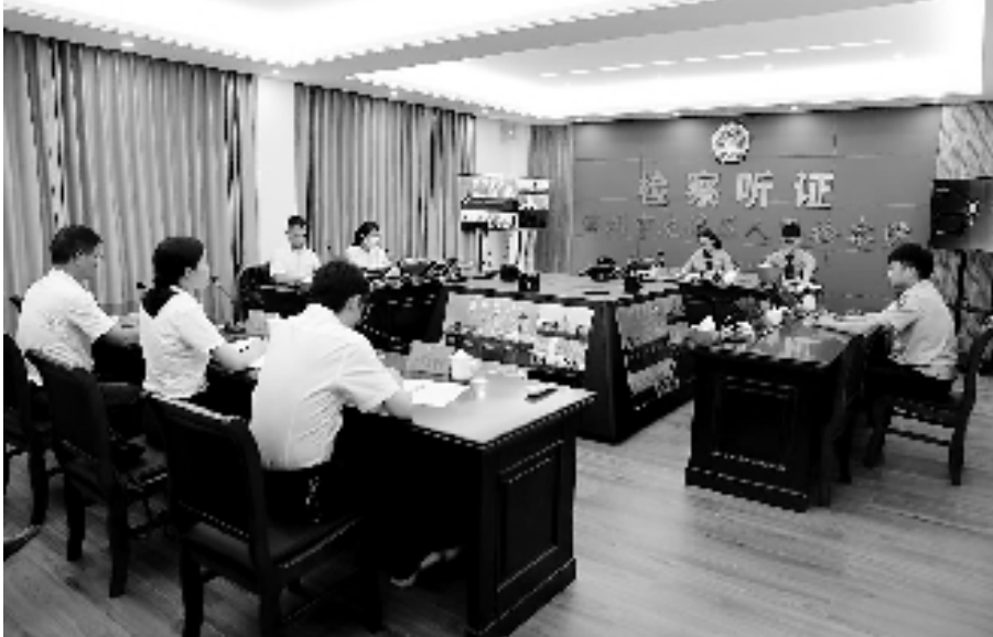
该院检察室举行检察公开听证,让群众在“家门口”参与监督“办案”