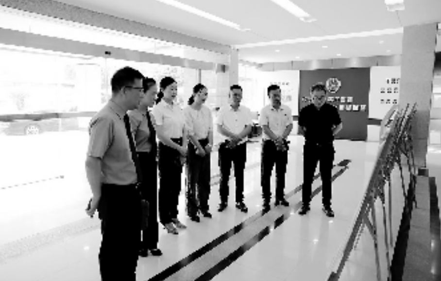
人大代表和政协委员实地参观了解龙湾区检察院关于打造“枫桥式检察室”情况

同时,龙湾区检察院经开区检察室以轻微刑事案件办理为抓手,深入推进诉源治理,化解矛盾纠纷,就近在检察室设置公开听证室,推行简易听证、集中听证,让群众在“家门口”参与监督,零距离感受公平正义。