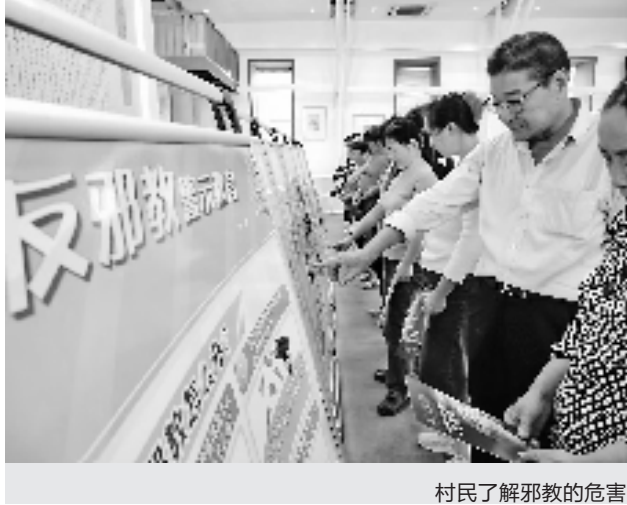
村民了解邪教的危害

在强化法治阵地守住善治成色的同时,大陈村以国家4A级旅游景区为建设标准,不断完善旅游服务配套设施,先后荣获全国生态文化村、省森林村庄、省森林人家、省生态文化基地、省生态宜居村等荣誉。