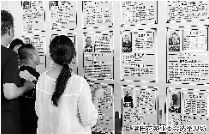
蓝田花苑业委会选举现场

草坪、拱桥、流水、绿树……走进平阳最大住宅小区——蓝田花苑安置小区,一副美好生活图景展现在人们眼前。蓝田花苑建有安置房22幢、3121套