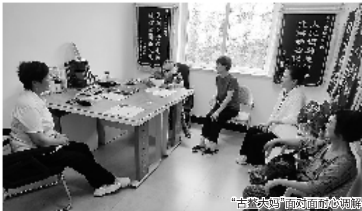
“古鳌大妈”面对面耐心调解

婚纠纷……“古鳌大妈”调解团战果累累,今年以来,已受理各类纠纷123件,并全部调解。