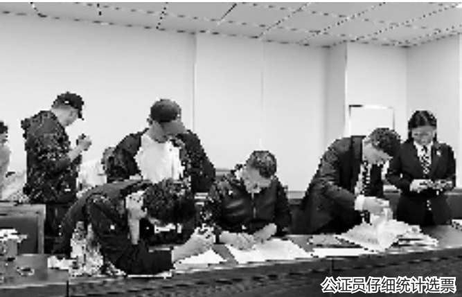
公证员仔细统计选票