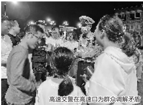
高速交警在高速口为群众调解矛盾