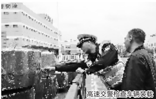
高速交警检查车辆装载