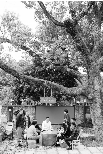
在杭州市余杭区小古城村一株老樟树下,村民在商议乡村发展事项(2022年3月14日摄)。

这就是“众人的事情由众人商量”全过程基层民主实践。小古城村逐步探索出“四议六步工作法”,全主体参与、全领域覆盖、全过程规范协商机制,形成“众人商量”