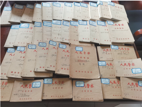
当年的工作笔记本

自2004年公安部提出“命案必破”的目标以来，整整13年，他终于真实触摸到这句话的“含金量”，浙江也自此进入“命案全破”的新时代：至2023年，连续7年实现现发命案全破，命案发案连续20年下降，为平安浙江建设增添了浓墨重彩的一笔，成为全国最安全省份之一。