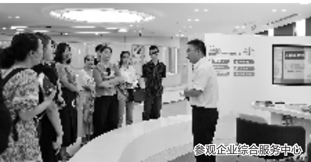
参观企业综合服务中心

钱塘是产业大区,良法善治是当地高质量发展的重要支撑。近年来,钱塘区聚焦打造市场化法治化国际化一流营商环境,各政法机关充分发挥职能,持续为各类经营主体输出优质高效便捷的法律服务,为企业健康发展提供最坚强的法治保障。