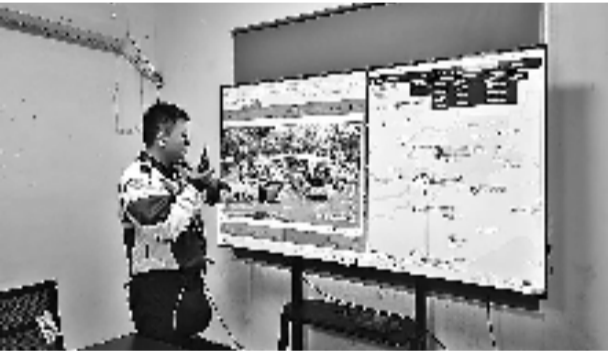
智能交通指挥调度云系统

近年来,瓶窑镇的变化清晰可见:交通路网体系不断优化,百姓出行更加便利;完成凤都智造谷及凤都二区等工业园区基础设施的提升改造,助力10家以上企业加速自主更新;全面推进千年古城复兴工