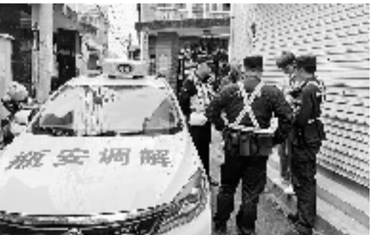
“及时雨”调处矛盾纠纷

化矛盾分析研判,疑难杂症协商共处;强化信访警情互通,联动联调成效显著;强化多元举措调解,助力提升群众幸福感、安全感,让平安在瓶窑镇看得见、摸得着、真实可感。