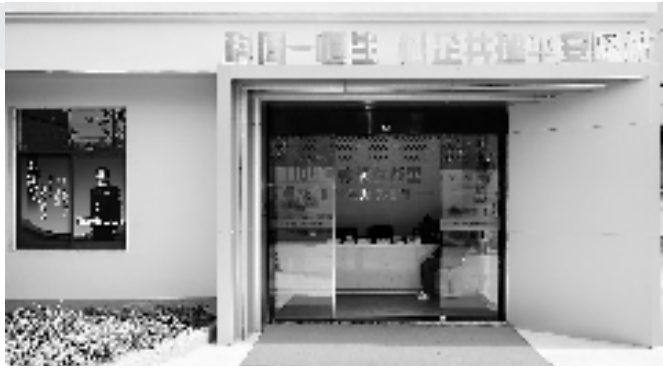
村企共建平安驿站

此外,“平安驿站”还组建志愿巡逻队、安全生产联盟等,每月15日“平安共建日”,村企平安共建联盟以轮值互查等形式,共同开展安全排查、治安巡防、平安宣传等活