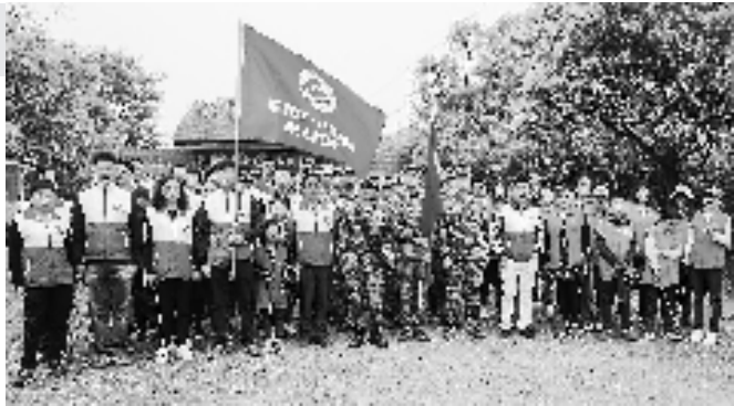
“爱心联盟”社会组织参与平安大巡防

为保障和鼓励村社争创“五无”,海宁市财政每年安排专项资金1600万元,作为“五无”村(社区)创建的先进单位工作经费、奖励经费,截至目前已发放