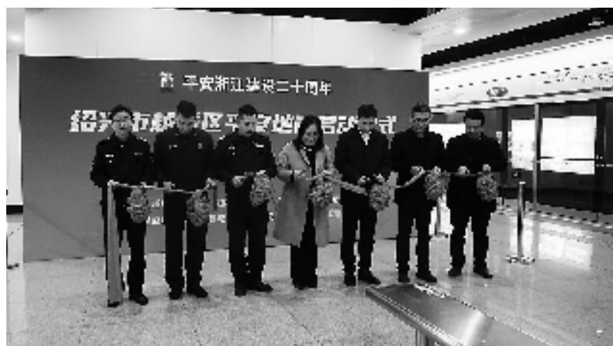
平安地铁启动仪式

“今年是平安浙江建设二十周年,我们希望通过‘平安地铁专列’的开通,为市民打造共同参与‘平安建设、扫黑除恶、反诈反邪’的好平台,进一步提升人民群众对平安建设的知晓率、参与率与满意率。”越城区委政法委相关负责人表示,接下来,当地将全面深化宣传引导,进一步推动落实平安越城建设主体责任,把“大平安”理念贯穿平安建设全过程。