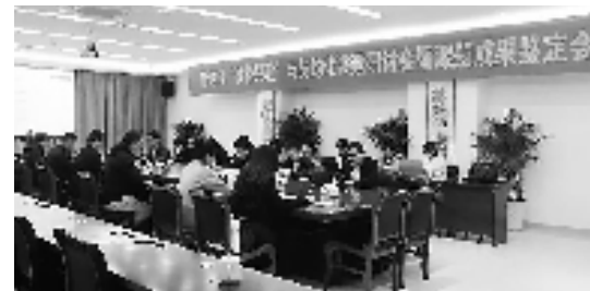
开展新时代“枫桥经验”课题研究

同时,越城区与高校合作,共同开展契约化党建课题研究,系统梳理当地近年来在坚持和发展新时代“枫桥经验”和党建引领城市基层治理方面的做法等,有效提升基层社会治理效能,为党建引领基层治理工作提供借鉴,相关研究成果《新时代“枫桥经验”与契约化共建研究》正在修订完善中。