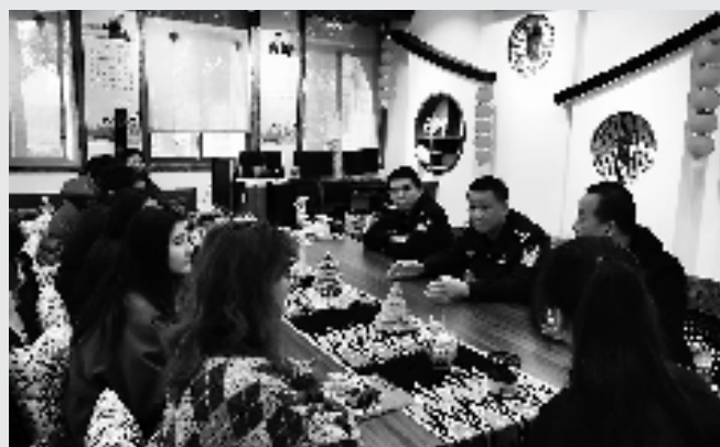
首个“校警共建”民族团结工作室