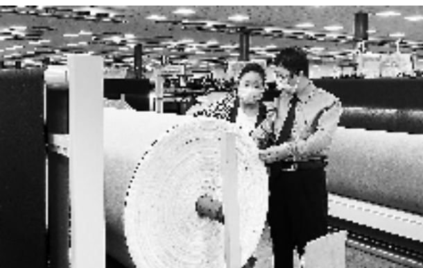
检察院干警走访纺织企业

“我们商场已经‘验收’通过,感谢平安警示教育站的工作人员,帮助我们解除安全隐患。”日前,兰溪市宝龙广场的负责人承诺,将时刻保持安全意识,争