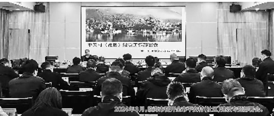
2024年3月,临海市召开全市平安村(社区)建设专题部署会。