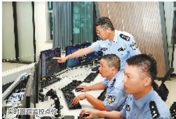
实时跟踪监控点位