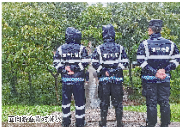
面向游客背对潮水