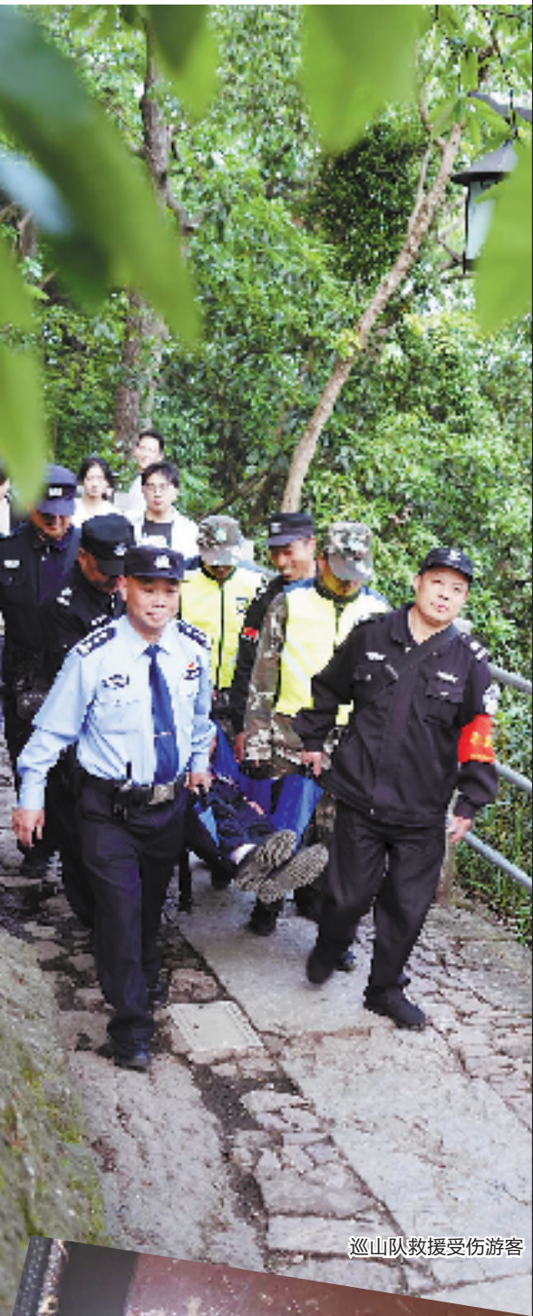
巡山队救援受伤游客