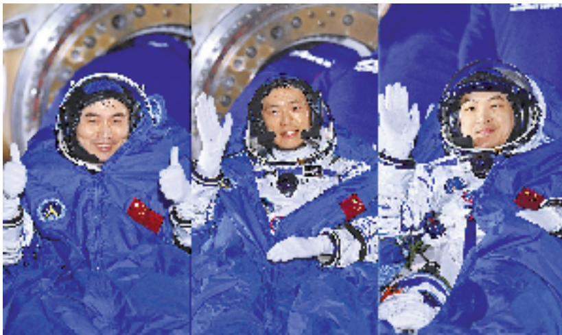
图为航天员叶光富、李聪、李广苏(从左至右)安全顺利出舱(拼版照片)

神舟十八号载人飞船于2024年4月25日从酒泉卫星发射中心发射升空,随后与天和核心舱对接形成组合体。3名航天员在轨驻留192天,期间进行了2次出舱活动,刷新了中国航