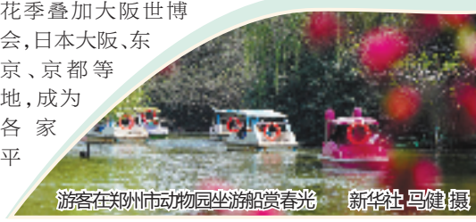
游客在郑州市动物园坐游船赏春光