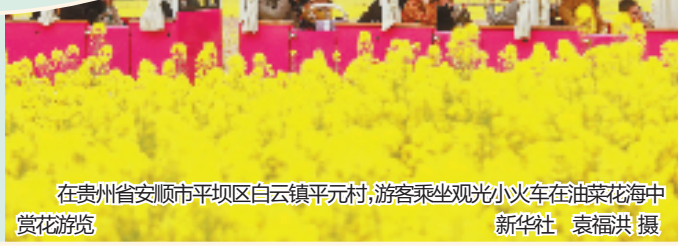
在贵州省安顺市平坝区白云镇平元村，游客乘坐观光小火车在油菜花海中赏花游览

假日期间，各类新业态催生“赏花+”新玩法。去上海顾村公园樱花岛来一场“夜间赏花”之约，观赏沪上首个沉浸式夜樱花光影秀；到江西、四川等地，搭乘直