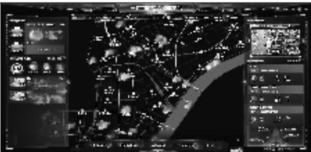
“一呼百应”综合指挥平台

城区也涌现了一批头特色、有亮点、有创新的举措。比如,采荷街道组建“中国服装第一街共治联盟”,由22家专业经营主体和街区管委会、派出所等单位联合开展日常巡逻,街区警情在辖区总警情中占比从35%下降至19%;湖滨街道整合商场、市场、文商旅等300余名共治力量,成立“商圈联盟”,做