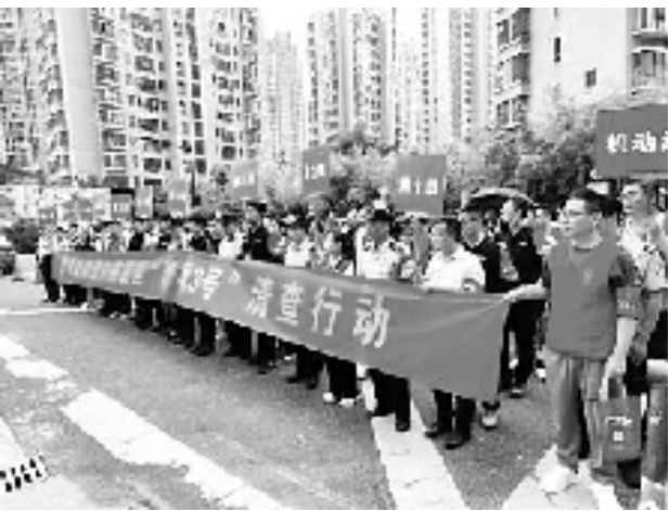
四季青街道矛盾纠纷风险隐患清查行动

钱江新城商圈是杭州市行政中心、金融总部和商贸集聚地,这里出行便捷、业态多元,是“城市客厅”也是“国际封面”,但也存在“治理体量大、热点关注大、辐射效应大”和“总部企业多、潮汐人口多、重点部位多”的特征。