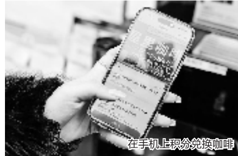
在手机上积分兑换咖啡