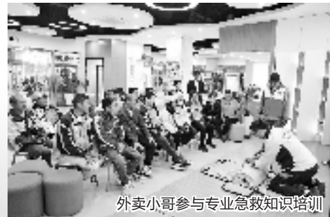
外卖小哥参与专业急救知识培训