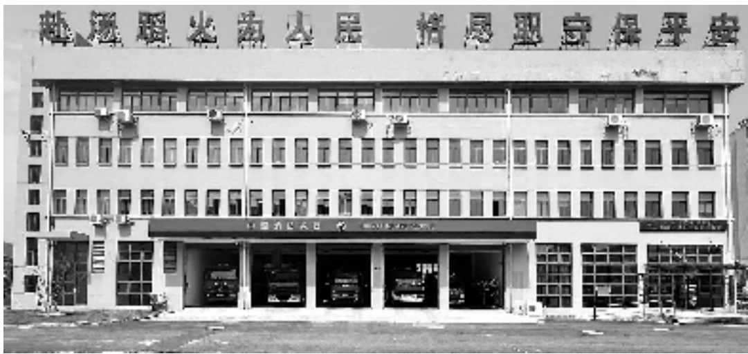
仙岩街道专职消防队

防范化解重大安全生产事故以及消防安全风险隐患,是保障群众生产生活的关键之举。瓯海区积极作为,层层落实组织架构重塑、人员设施整合、治理模式完善等“三举措”,统筹推进基层应急消防体系建设与基层治理深度融合,全力构建起基层应急消防治理新格局。